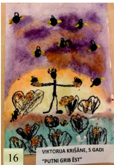
VIKTORIJA KRIŠĀNE, 5 GADI “PUTNI GRIB ĒST”