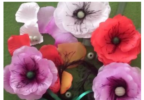
„Pūcišu” vecāku darinātās magones

PII „Zeltrīti” rudenī ir izveidojusies jauka tradīcija – rīkot rudens gadatīrgu, kura saknes noteikti meklējamas jau dažas paaudzes iepriekš - droši vien kādam apņēmīgam Miķelim pa godu, kas spējis savu rudens ražu iemainīt vai pārdot. Mūsu Miķeļdienas gadatīrgus apvieno un iedvesmo bērnus, viņu vecākus un skolotājas. Tā kā mūsu „Pūcišu” grupā šādi pasākumi tika piedzīvoti un apzināti, tad 2016.gada tīrgus tika organizēts ar mērķi – par iegūtiem līdzekļiem iegādāties bērniem izlaiduma dienai vienotu dekoru - magones, kas rotātu meiteņu un zēnu svētku tērpu. Mums tā likās jauka doma, jo varu apgalvot, ka šis darbības iznākums ir ar pievienoto vērtību, kuru nespēj aizstāt nekādi zemes labumi - magones tapa no it kā rožu lapiņām