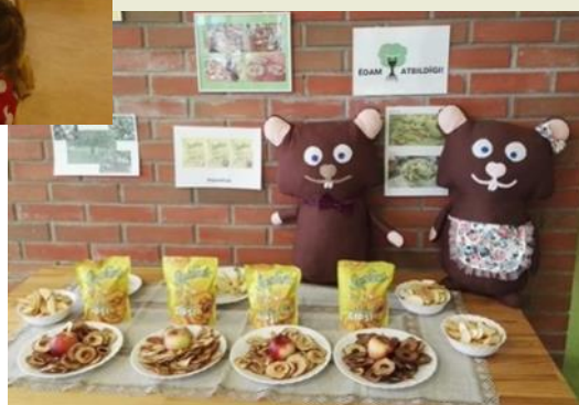
Ābolu čipsu degustācija