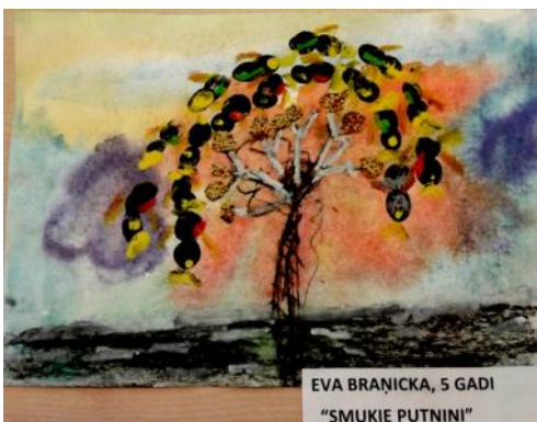
EVA BRANICKA, 5 GADI “SMUKIE PUTNINI”

< Februārī piedalījāmies Čučupūces konkursā - no otrreizējiem materiāliem darinājām putnu barotavas, vērojām putnus un savus vērojumus bērni attēloja zīmējumos. Konkursā ieguvām atzinības rakstu un veicināšanas balvu!