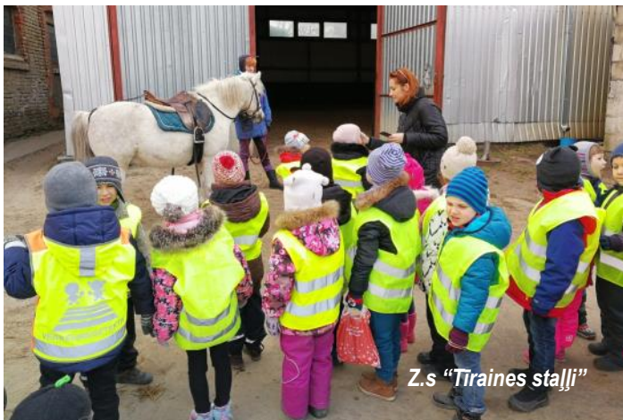
Z.s "Tiraines stalli"

Cielaviņu grupas bērniem īpaši mīļas ir pastaigas. Tās dod iespēju izrauties no ikdienas pierastā mācību ritma, pieredzēt un ieraudzīt ko jaunu tepat tuvējā apkārtnē. Šogad esam devušies divos pārgājienos. Pirmais bija uz eko-veikalu "Unce", un otrs - uz tuvējo zirgu stalli.