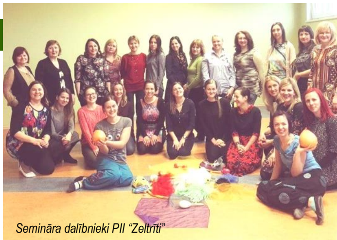
Semināra dalībnieki PII "Zeltrīti"