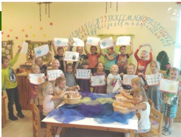
Piedalījāmies konkursā “Mazgā rokas”.