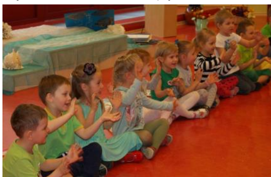
"Zilītes" visu gadu pētīja, kā izaug vardītes

Ūdeni lietojam katru dienu - vai mēs mazgājam rokas, vai gleznojam - ūdens mums ir nepieciešams! Bet, vai zinājāt, ka ar ūdens palīdzību var arī muzicēt? Arī Zvirbulīši izmēģināja uzspēlēt ūdens orķestri, un viņiem tas lieliski izdevās! Lepojos, ka Zvirbulīšiem izdevās sagatavot informatīvu bukletu "Esi dabai draudzīgs, taupi un nepiesārņo ūdeni". Ar šiem bukletiem devāmies ekskursijā uz Mārupes novada domi, lai uzdāvinātu tos domes deputātiem un darbiniekiem, pievērstu sabiedrības uzmanību ūdens taupīšanai un piesārņošanai, šos bukletus dalījām arī cilvēkiem uz ielas. Iepriecina, ka sastaptie mārupieši bija atsaucīgi, un ar prieku aprunājās ar bērniem, stāstot par saviem ūdens taupīšanas paņēmieniem.