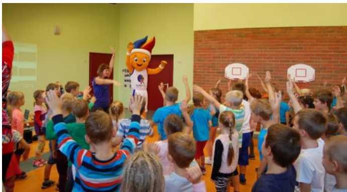
Kopā ar Frenkiju vingro visi!