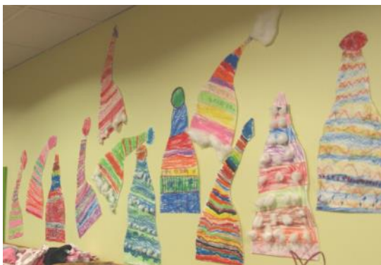
Tik košās, „Gulbīšu” izrotātās micēs pie rūķīšiem noteikti nāks tikai labi sapnīši!