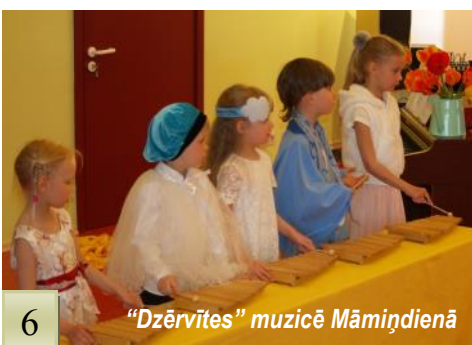
"Dzērvītes" muzicē Māmiņdienā

Katrs bērns ieguva diplomu ar īpašu caļa titulu, ko bija piešķirusi žūrija. Uz Mārupes novada konkursu, kas kā tradīcija katru gadu notiek Zajājā ceturtdienā, tika izvirzīti 7 dziedātāji, kas pārstāvēja Pil "Zeltrīti". Prieks, ka uz lielās Mārupes kultūras nama skatuves bērni jutās droši, pārliecinoši un iepriecināja gan skolotājas, gan visus klātesošos skatītājus un klausītājus. Esam gandarītas par saviem dziedošajiem cāļiem!