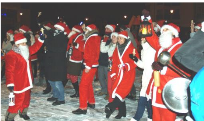
Paldies vecākiem par atbalstu Ziemassvētku pasākumos! Rūķu gājiens

Visiem zināms, ka izdalītie materiālie līdzekļi nav pietiekoši sunīšu un kaķīšu labai dzīvei dzīvnieku patversmē. Protams, lai labdarības akcija pilnvērtīgi notiktu, ļoti lielu palīdzību sniedza vecāki- gan ar padomu, gan materiāli. Aizvedot ziedojumus, dzīvnieku patversmes darbinieki sacīja mums lielu paldies par apciemošanu, palīdzēšanu, ziedošanu, iejūtību, uzņēmību, labām domām un vienkārši par labas attieksmes izrādīšanu. „Zeltrītu” organizētais labdarības pasākums bija izdevies!