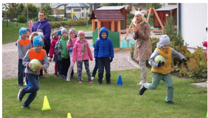
Rudens sporta svētkos "Dzeniši" nes kāpostgalvas Zaķenam

Septembrī bērni čakli iesaistījās arī sporta svētkos "Zaķēns un