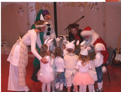
Ziemassvētku pārsteigums „Zeltgalvišiem”

Svētku nedēļā mums atveda eglītes, kuras tika izvēlētas jau rudenī, tās bija kuplas un ļoti skaistas, par ko bērni ļoti priecājās. Mēs eglītes kopīgi izrotājām ar vecāku sarūpētajiem rotājumiem. Mazā eglīte tika izmantota Ziemassvētku priekšnesumam, kur tajā kopīgi iededzām svētku gaismiņas.