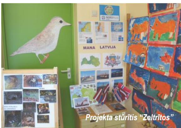
Projekta stūritis "Zeltrītos"