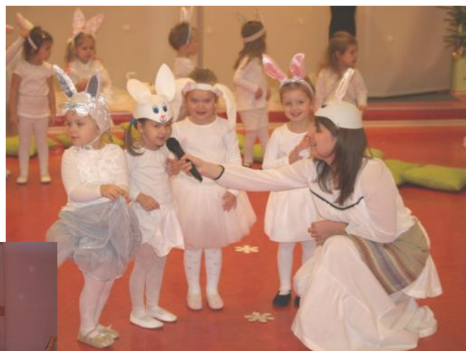
„Stārķīšu” baltie zaķēni ar skolotāju

Rūpīgi gatavojamies, jo Ziemassvētku pasākums bija mūsu pirmie kopīgie svētki, ko mēs parādījām vecākiem. Mēs dziedājām dziesmiņas, skaitījām dzejolišus un dejojām dejas. Lielu sajūsmu izraisīja mirklis, kad ieradās Ziemassvētku vecītis, kas mūs bija vērojis visu Ziemassvētku laiku. Gan bērni, gan vecāki kopīgi devāmies rotājās, skaitījām vecītim dzejoļus. Pēc pasākuma devāmies uz mūsu grupiņu, kur skaitījām dzejoļus, dziedājām dziesmas un saņēmām dāvanas.