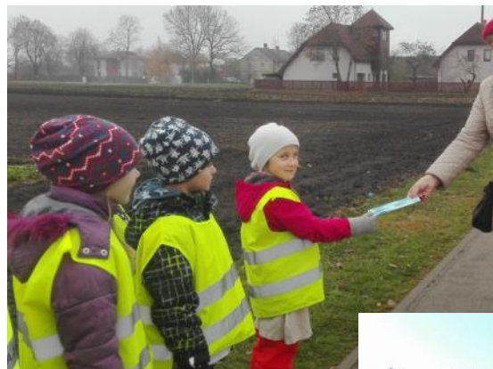
"Zvirbulīši" daļa bukletu par ūdens taupīšanu Mārupes iedzīvotājiem

Visi šogad esam bijuši čakli pētnieki, kas Ekoskolas ietvaros paveikuši lielus un mazus darbus par ŪDENI. Gan pilnveidojām savus priekšstatus par ūdeni, tā īpašībām, nozīmi, lomu cilvēku dzīvē un apkārtējā vidē, gan eksperimentējām, lai parādītu to, ka ūdens ir ne tikai dzīvībai svarīgs, bet arī ļoti interesants resurss. Grupās organizējām gan garšu laboratorijas, praktiski veicām ūdens filtrēšanu, taupījām ūdeni ikdienā, gan mākslas aktivitātēs radoši darbojāmies ar ūdeni. Grupa "Zvirbulīši" izveidoja bukletu par ūdens taupīšanu, ko prezentēja Mārupes Domes deputātiem un darbiniekiem, kā arī vietējiem iedzīvotājiem. Kopīgi PII "Zeltrīti" esam aizvadījuši divus lielus Ekoskolas pasākumus, kas veltīti ūdens tēmai. Novembrī tika organizēts pasākums "Kas ir ūdens?", kur katra grupa prezentēja jau izziņāto un Rīcības dienās veidotos plakātus par ūdeni. Savukārt aprīlī notika ūdens tēmas noslēguma pasākums "Kad Burbulīte ciemos nāk", kurā bērni