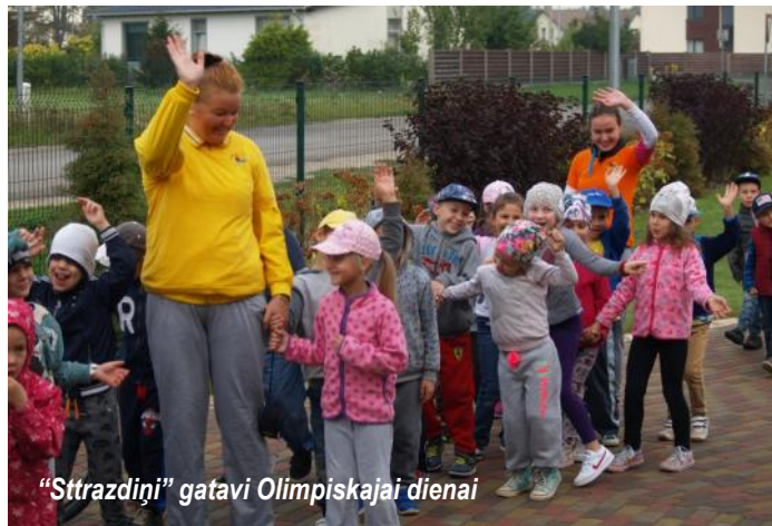
"Strazdiņi" gatavi Olimpiskajai dienai