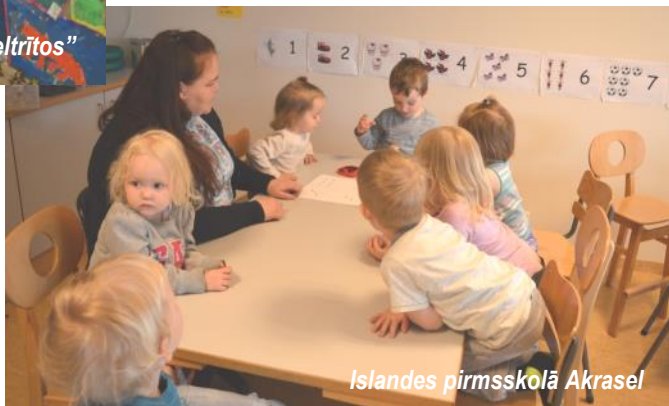
Islandes pirmsskolā Akrasel