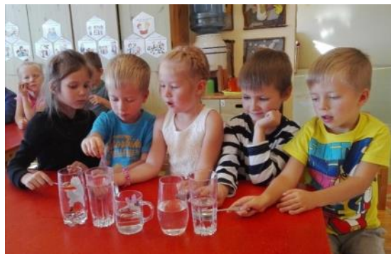
Zvirbulīši pēta ūdeni

Mēs, skolotājas, liekot lietā nedaudz iztēles, sapratām, ka ūdens kļūst par aizraujošu tēmu mācību procesā. Katras grupiņas skolotāja iepazīstināja pirmsskolēnus ar ūdens īpašībām, ūdens nozīmi cilvēka un visas planētas