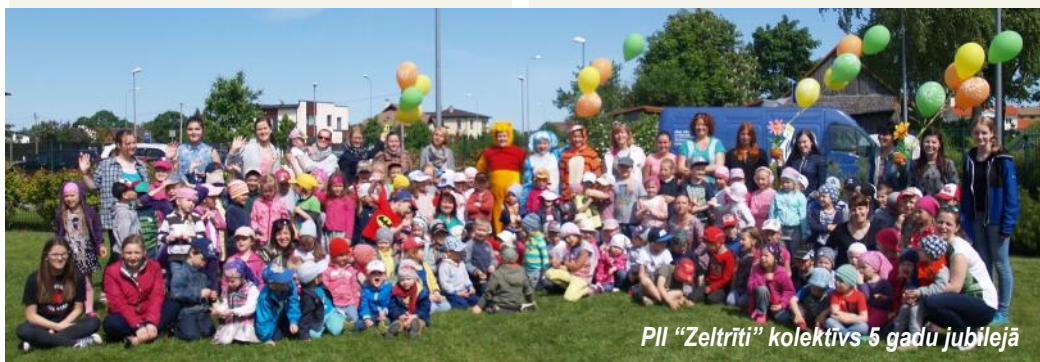
PII "Zeltrīti" kolektīvs 5 gadu jubilejā

Zeltrīti, Zeltrīti Mani jau gaida! Zeltrīti, Zeltrīti Visiem mums smaida! (visu atk. 2x)