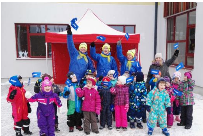
"Cielaviņas" pasaules Sniega dienā satiek Minjonus

Janvārī "Pasaules sniega dienā 2016" bērnus priecēja pasaulē populārie multiplikāciju filmu varoņi - Minjoni , kuri bija ieradušies, lai kopā ar bērniem baudītu ziemas priekus un kopā orientētos iestādes apkārtnē. Viņi bija čakli strādājuši un bērniem sagatavojuši īpašās minjonu kartes ar foto attēliem, kuri bija jāatrod dabā. Attēlā redzamajās vietās multiplikāciju varoņi bija parūpējušies par interesantiem, sportiskiem un atjautīgiem uzdevumiem. Īpašu prieku sagādāja hokeja spēle, īsta jautrība valdīja ragaviņu vilkšanā, smaidu sejā radīja eņģelišu veidošana sniegā. Pašus mazākos uzjautrināja īpašā Minjonu pasaku eglīte, kas bija izrotāta ar