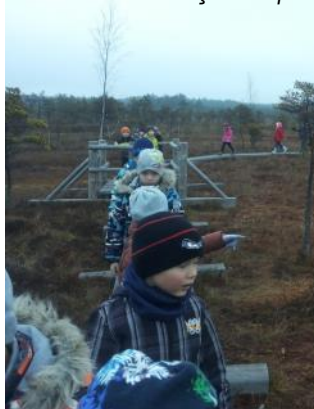
"Dzenīši" Ķemeru purvā

Saistībā ar EKOTēmu centāties dažādi pētīt ūdeni. Nākamais mūsu izpētes objekts bija pazemes ūdeņi. Tos devāmies iepazīt uz Gūtmaņu alu Siguldā. Klāt tam visam skaistās rudens