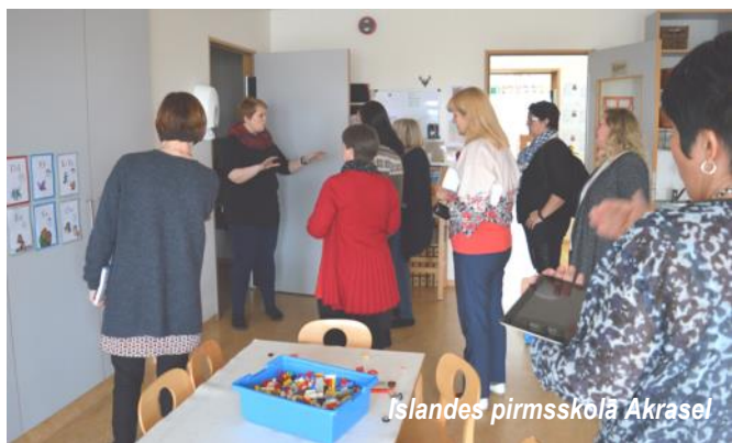
Islandes pirmsskolā Akrasel

Īstenojot Nordplus Jauniešu programmas projektu „Today a child - tomorrow a leader”, esam ieguvuši unikālu pieredzi un zināšanas, kā pilnveidot mūsu ikdienas darbu PII “Zeltrītos”, izveidojuši sadarbību ar kolēģiem Skandināvijā, un, nenoliedzami,