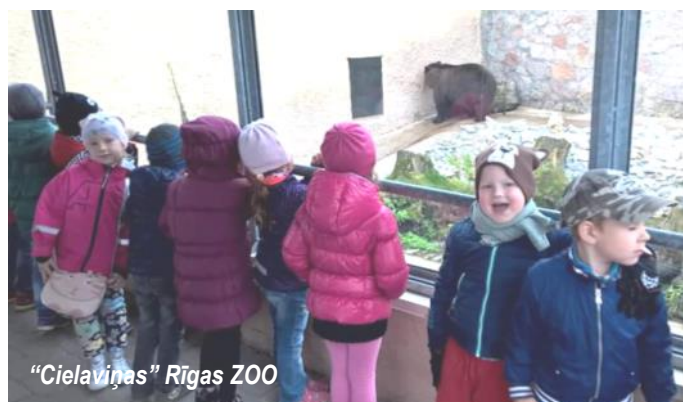
"Cielaviņas" Rīgas ZOO

Ne tikai mūsu grupa dodas ekskursijās. Dzērvītes, Cielaviņas un