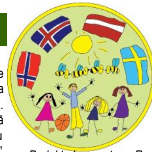
Projekta logo autore: Renāte Ozola no "Zvirbulīšiem"

iepazīstos ar Norvēģijas izglītības sistēmu, pedagogiskajām metodēm ikdienas darbā ar pirmsskolas vecuma bērniem, apmeklētu vairākus privātos bērnudārzus, kā arī iepazītos ar Norvēģijas kultūru, tradīcijām un vēsturi. Haugland