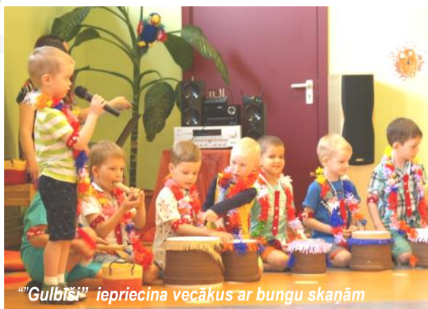
“Gulbiši” iepriecina vecākus ar bungu skaņām