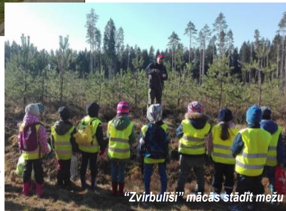
"Zvirbulīši" mācās stādīt mežu

interaktīvi kopā ar Burbulīti un Mikrobiņu ceļoja pa ūdens pasauli, skatījās izglītojošās īsfilmas par roku mazgāšanu, kā arī katra grupa radoši stāstīja par savu izveidoto "Ūdens Eko grāmatu", kas tagad pieejamas dabas centrā. Nākamajā gadā esam nolēmuši ēst atbildīgi, jo pavasarī ar lielu aizrautību pieteicāmies atlasei dalībai Ekoskolas projektā "Ēdam atbildīgi", jo veselīgs uzturs ietver sevī visas barības vielas, kas nepieciešamas bērnu augšanai, fiziskai un garīgai attīstībai un aktivitātei. Projekta ietvaros plānojam kopā ar "Zeltrītu" bērniem izvērtēt, kāda ir produktu iepirkšanas politika ģimenēs un sabiedrībā, aktīvi audzēt paši savus dārzeņus gan grupās, gan āra teritorijā. Kulinārijas nodarbībās gatavosim veselīgus ēdienus un dzērienus, veiksīm dažādus pētījumus par produktu izcelsmes valstīm un to sastāvu, kā arī veidosim un nostiprināsim bērniem priekšstatus par atbildīgu ēšanu, atbildīgu iepirkšanos caur praktiskām un izglītojošām ikdienas aktivitātēm pirmsskolā, spēlēm un lomu rotaļām, kā arī informēsim visus par mūsu pētījumu rezultātiem un aicināsim citus ēst atbildīgi!