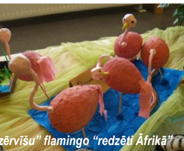
"Zeltrītu" flamingo "redzēti Āfrikā"

"Pūcišu" grupai mīļākā izstāde bija tā, kurā varēja piedalīties ar pašu gatavotām rotaļlietām (attēlā). Mūsdienās vairs tikai daži spēj mājas apstākļos un savām rokām izgatavot rotaļlietas, kas priecē paša bērnu. Vislielāko bērnu sajūsmu sagādāja Lolipopa , kas tapa ar tēta un mammas palīdzību no, nu jau par mazām kļuvušām zeķubiksēm un krekliņa, bet tas nemazina pievienoto vērtību bērna acīs. Skolotājām bija iespēja savu meistarību parādīt salmu zaķu taisīšanā, kas uzjautrināja ne tikai viņas, bet arī pirmsskolas apmeklētājus. Vērienīgajā Mākslas dienu izstādē "Esmu mākslinieks" no "Pūcišu" un "Zvirbuļu" grupas piedalījās katrs bērns ar savu labāko darbu. Nevaru apgalvot, bet ļoti ceru ka arī no pārējām grupām piedalījās visi! Gadu noslēdzot, kad dažās grupās pirmsskolnieki pārtop par skolniekiem, varam vērot brīnumainas pārmaiņas, kas atspoguļojas izstādē "Brīnumpuķe".