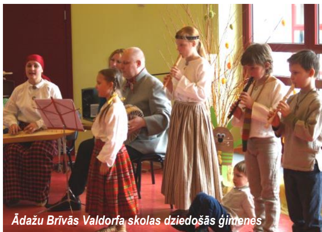
Ādažu Brīvās Valdorfa skolas dziedošās ģimenes

Lieldienas ir pavasara saulgrieži, ko svinam par godu pavasara un saules atnākšanai, kad gaisma svin uzvaru pār tumsu. Saules un gaismas tēma pavasarī ir aktuāla, tāpēc svētku gaitā kopā ar kaimiņu grupu bērniem, "Zīlītēm" un "Cīrulišiem" meklējām silto vasaras saulīti. Centāmiem būt radoši veidojot rotaļas un piedaloties āra aktivitātēs. Piedomājām par to, lai mūsu bērniem