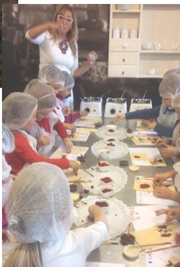
"Strazdiņi" Laimas šokolādes muzejā

Saistībā ar EKOTēmu centāties dažādi pētīt ūdeni. Nākamais mūsu izpētes objekts bija pazemes ūdeņi. Tos devāmies iepazīt uz Gūtmaņu alu Siguldā. Klāt tam visam skaistās rudens