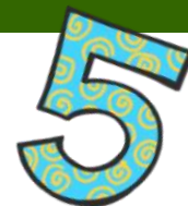
2015.gada izlaiduma grupas gatavojoties skolas gaitām