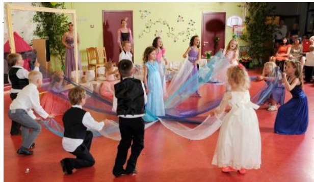
„Lakstīgalu” 2013.gada izlaidumā