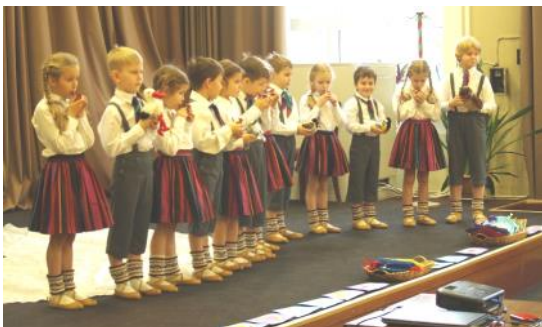
Labdarības koncerts SAC "Mežciems"

bērnu meistarība muzikālajos teātros, sportiskais gars un emociju pilni brīži sporta zālē, kustību prieks par veicamajiem