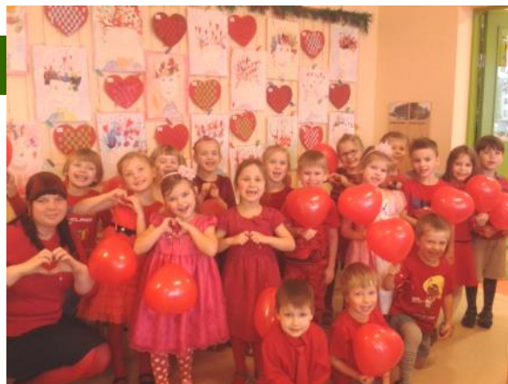
Sirsnības mēnesis "Zvirbulīšos" 2015.gadā

Atceros, kā skolotājas, atnākot uz šo dārziņu pirms 5 gadiem, tika iepazīstinātas ar savam jaunajām „otrajām mājām”- grupiņām (grupiņām doti Latvijas putnu nosaukumi). Domāju pie sevis: - Laimīgā skolotāja - vienai Lakstīgalu grupa, citai- Gulbīši, vēl citai Stārķīši, nez, kāds putniņš man tiks ierādīts? Nonākot līdž Zvirbulīšiem tajā brīdī, kad jaunajās mājās aicināja mani, varbūt mazliet sadrūmu - tāds necils putniņš... bet ieejot savā grupiņā, ieraugot šīs plašās gaišās telpas, sapratu, ka būs plašas iespējas tās apdzīvot, jo pašā sākumā jau bija tikai tas minimālais – to, ko citos dārziņos pedagogi iekārtojuši vairākus gadus, mums nācās apdzīvot krietni īsākā laika sprīdī. Un tā, ar lielu aizrautību kopā ar