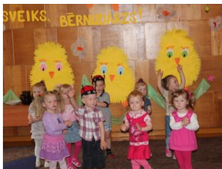
Balvu PII "Sienāzītis" audzēkņi

Ka skolotājas un skolotāju palīdzes ciemojās un bagātinājušās pieredzē Balvu PII "Sienāzītis", pie privātas publiskās partnerības projekta kolēģiem - Ķekavas PII "Bitīte" un Tukuma PII "Karlsons", Ķemeru PII "Austraskoks", Rīgas PII "Ābecītis" un PII "Austrīņa", Valmieras PII "Ezītis" ar filiāli "Ābelīte", privātajos PII "Mazulītis Rū" un "Montessori bērnu māja", pie Mārupes un Norvēģijas kolēģiem u.c.