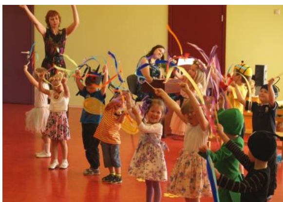
„Zeltgalviši” Māmiņdienas koncertā