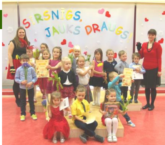
Izteiksmīgas runas konkursa noslēgums