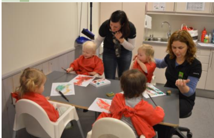
Mazie norvēģu audzēkņi darbojas ar pirkstiņkrāsām

Sanāksmes noslēgumā devāmies uz Byrkjedal sveču fabriku, Gloppedalsuru - lielāko akmens krāvumu Ziemeļeiropā un šokolādes fabriku Engersundā .