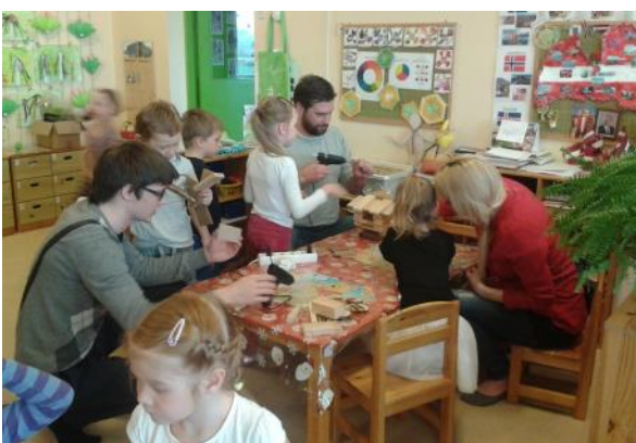
Vecāki piedalās nodarbībā.

Vecāki piedalās nodarbībā. Un diena tiešām izvēršas laba! Vecāku vakarā pateiktais: "Paldies!", sniedz gandarījumu un vēl vairāk apliecina iekšējo sajūtu – diena tiešām bija laba! Tieši ar lielu vecāku līdzdarbību, savu grupiņu bērnus pašai tā īsti nemanot esmu ievirzījusi īpaši izteiktai mīlestībai pret dabu. Tā ir sagadījies, ka visus šos darba gadus, man ir paveicies ar cilvēkiem, kuriem arī ikdienā ekoloģija un rūpes par dabas saudzēšanu nav svešas. Ir izveidojusies ļoti laba sadarbība ar AS "Latvijas valsts meži" pārstāvjiem. Ar saviem pirmā izlaiduma Zvirbulīšiem (2013.g.) veicām pētījumu, kā videi draudzīgāk nokļūt no Mārupes līdž Rīgai, ziemā kopā ar mežzinī braucām barot meža zverus un snieģā pētījām meža zveru pēdas.