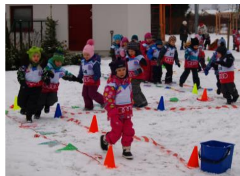
Pasaules Sniega dienas stafete

Šogad pašvaldībās kopā ar Latvijas Slēpošanas savienību, veikalu tīklu „FANS” un Latvijas Olimpisko komiteju organizētajiem Pasaules Sniega dienas pasākumiem bijapieteikušies vairāk nekā 130 pasākumu organizatori, iesaistot šajās ziemas aktivitātes vairāk kā 23 000 dalībnieku. Vairāk informācijas www.infoski.lv