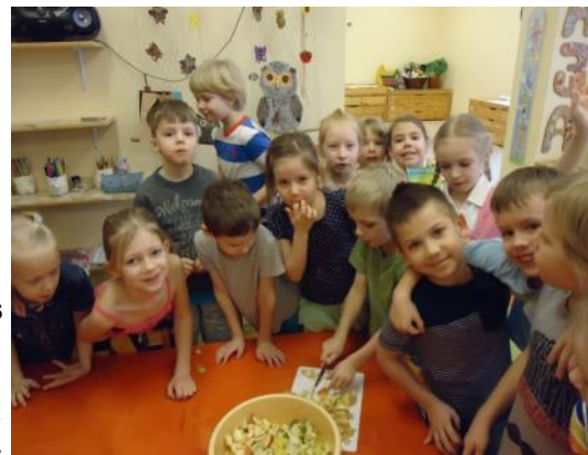
Šī gada absolventi - "Pūcītes"