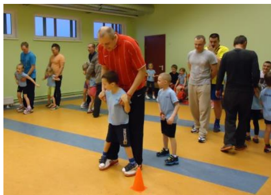
"Gulbīši" 2013.gadā Tēvu nedēļas sporta dienā