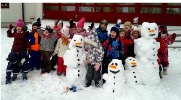
Jaunākā "Gulbīšu" grupiņa 2015.gada ziemā

un 2014.gadā. Tā sanācis, ka šopavas ar gatavojamies izlaidumam kopā ar mazajiem pūčulēniem. Ikviens bērns, aizejot no bērndārza, paņem mazu daļiņu mūsu sirds,