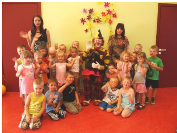
Šie "Zvirbulīši" izlidoja uz skolu 2013.gadā

Vecāku no rīta pateiktais: "Lai Jums laba diena!", iesēj dzīvesprieku visai atlikušajai dienai. Un ar šiem 5 gadiem tas ir ļoti pozitīvi audzis. Vecāku no rīta pateiktais: "Lai Jums laba diena!", iesēj dzīvesprieku visai atlikušajai dienai. Un ar šiem 5 gadiem tas ir ļoti pozitīvi audzis.