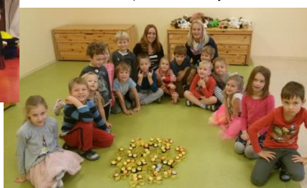
“Lakstīgalas” Rīcības dienās

Mans novēlējums: - Lai vienmēr, vienmēr pasaulē Jums būtu kaut kas, ko gribat iemācīties, ko vēlaties darīt, kāda vieta, kur vēlaties nonākt, cilvēks, kuru gribat satikt!