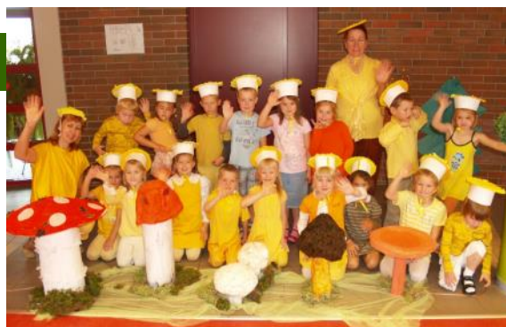
„Dzērvītes” 2011.gada Sēņu ballē

Nu jau vairākus gadus esam iesaistījušies EKO skolu programmā. Pirmajā gadā „Dzērvītēm” arī bija dots konkrēts uzdevums: izzināt, kur tad paliek visvisādi atkritumi, t.i., kur paliek papīri, piemēram, pēc aplicēša-nas nodarbībām? Mēs taču tos nemetam atkritumu grozā, bet gan speciāli iedotā Līgatnes papīrfabrikas kartona kastē, noskaidrojām, kur paliek mūsu sētnieka nopļautā zāle - izrādās, ka tā tiek atdota Tīraines zirgu stallim. Kopā ar „Dzērvītēm” svinējām Lieldienu Doles salā, bet vienus no spilgtākajiem iespaidiem bērni guva ekskursijā uz Rīgas lidostu. Tur iepazīnām-