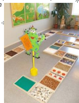
Mūsu jaunums - sajūtu taka

tūkstoši skolas un 13 miljoni skolēnu. Ikviena skola var brīvprātīgi pievienoties Ekoskolu saimei, veicot videi un ilgstējas principi atbilstošas rīcības, vairāk informācijas – www.videsfonds.lv .