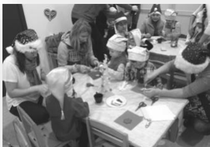
Zeltgalvīši Saldumu darbnīcā

slēpjas Rūķīši – lieli un maziņi. Un kādu vakaru daži pēkšņi uzradās Rūķu gājienā, bet pēc neliela laika varēja manīt jau visisādas Rūķu cepures – lielas, mazas, krāsainas, spīdīgas, ar pušķīšiem, bez pušķīšiem, kas izkārtojās košā izstādē. Un tad jau bērni ar lielu