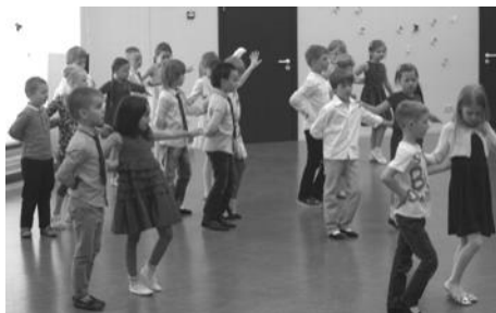
“Zīlītes” māc gan lasīt un rakstīt, gan skaisti dejot!

Mēs tam ticam un uzdrošināties kopīgiem spēkiem, strādājot komandā, plānot un realizēt jaunas idejas, meklējot radošus un interesantus risinājumus, lai padarītu mūsu audzēkņu pirmsskolas izglītības saturu programmas apguvi krāsaināku un iespajdiem bagātāku. Kopējo pasākumu organizēšana mūs padara vienotākus un drošākus, došanās ekskursijās paplašina izzīņas redzesloku, piedalīšanās EKO skolā un projekts padziļina zināšanas par konkrētām lietām, nostiprina koncentrēšanās spējas. Šogad tēmu vienai nedēļai mēnesī katra skolotāja izvēlējās brīvi pēc saviem ieskatiem, un, protams, atbilstoši vecumam. Šajā brīvēs izvēles nedēļā uzstādījums bija vienu dienu pievērst bērnu uzmanību kādai no eko tēmām. Realizējot gada galveno