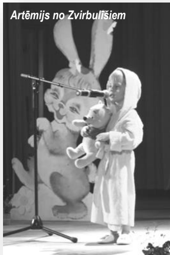
Artēmijs no Zvirbulīšiem