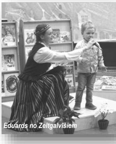
Eduards no Zeltgalvišiem

2013.gada 28. novembrī PII "Zeltrīti" pieskandināja izteiksmīgās runas konkurss "Skani, mana valodiņa". Šis konkurss ir viena no "Zeltrītu" tradīcijām un ar katru gadu tas kļūst skanīgāks un ir pārsteigumiem bagātāks. Šogad konkursa tēma bija "Latvijas dabas skaistums" - par