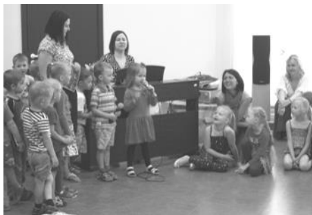
“Strazdiņi” 28.maijā sveic izlaiduma grupas

Mums nekad nav dāvāti sapņi bez iespējām tos piepildīt! ( Ričards Bahs).