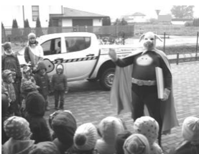
16.oktobrī tikāmies ar Cūkmenu, kurš atgādināja, ka mežus nedrīkst piemēslot