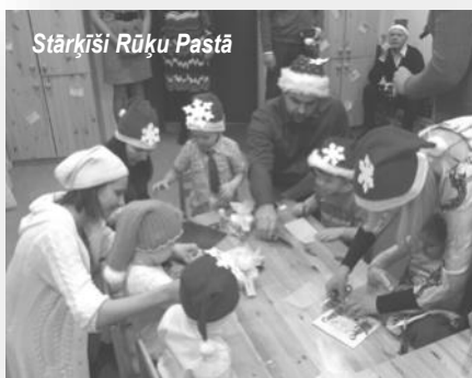
Stārķīši Rūķu Pastā

Šogad Ziemassvētku pasākumi bērniem PII „Zeltrīti” notika savādāk, nekā iepriekšējos gadus. Jau decembra sākumā varēja jaust nelielu svētku noskaņu, jo ciemos bija atnākuši, atlidojuši, atbraukuši lieli un mazi Rūķīši. Tikai šos Rūķīšus uzreiz nevarēja pamanīt. Tie bija paslēpušies it visur – grupiņās, sporta zālē, mūzikas kabinetā, pie griestiem, āra laukumiņos, medmāsiņas kabinetā, pie pavāriņiem, pat pie vadītājas. Tos varēja tikai nojaust. Bet bērni gan zināja, ka kaut kur