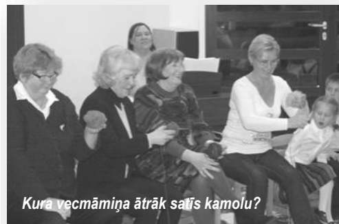
Kura vecmāmiņa ātrāk saīs kamolu?