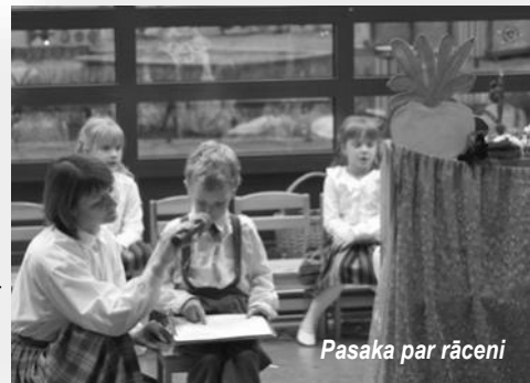
Pasaka par rāceni