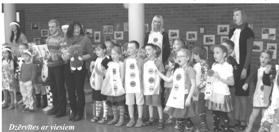
Dzērvītes ar viesiem

Pēc visu grupu prezentācijām, Piena paka un Lapsiņa bērniem sarīkoja dažādas aktivitātes – „Šķiro – būs tīrs!” – bērni šķiro-