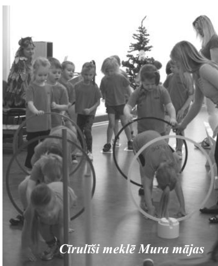
Cīrulīši meklē Mura mājas