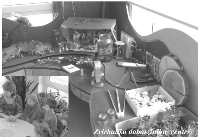
Zvirbulīšu dabaszinību centrs

Dabas centrā mums ir arī dažāda lieluma magnēti, kas padara atklājumus vēl interesantākus, jo bērni darbības procesā atklāj, kas magnētam pieķeras, kas nē un līdz ar to mēs uzzinām, pie magnēta pievelkas tikai metāls.