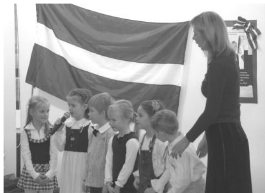
Dzērvītes Latvijas dzimšanas dienā

sastāv no daudziem novadiem un pilsētām, kur dzīvojam, bet katru lielumu vislabāk iepazīt no tā mazajām sastāvdaļiņām, tādēļ gribam veicināt mūsu audzēkņu ģimeņu interesi tieši par sava novada vēsturi un iesaistīšanos šā brīža sabiedriskajās norisēs. Pirmās adventes koncertā uz kultūras nama lielās skatuves uzstājās 35 mazie dziedātāji un dejojāji no dažādām grupiņām, tai skaitā, arī ansamblja „Balstiņa” dalībnieki.