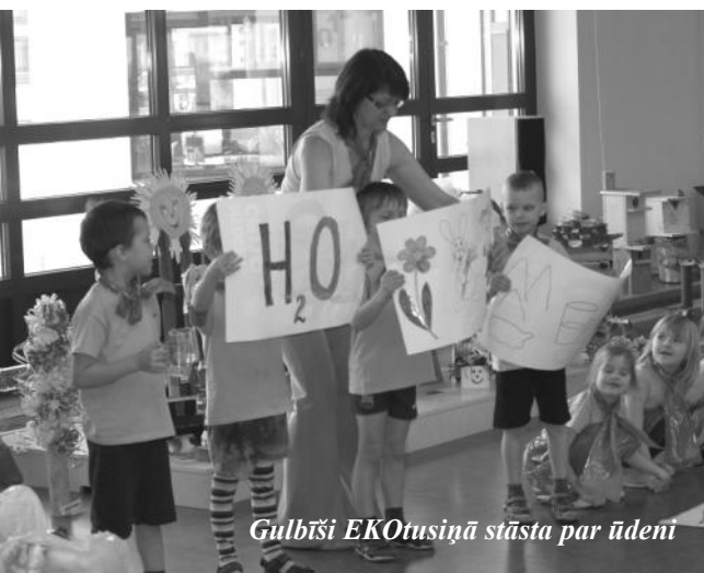
Gulbīši EKOTusiņā stāsta par ūdeni

Cīruliši organizēja savā grupiņā burkānu dienu – burkāni tika pētīti, garšoti, zīmēti, aplicēti, veidoti. Dzeniņi pavasara sākumā iesēja dažādus garšaugus, ar mīlestību audzēja tos un tad ar baudu garšoja, kā arī mācījās šķirot atkritumus. Gulbīši sarīkoja orientēšanās spēles gan bērniem, gan vecākiem. Pasākums sākās ar īsu gulbīšu priekšnesumu par dabas aizsardzības tēmu. Pēc tam visi tika aicināti piedalīties orientēšanās spēlēs. Bērni ar vecākiem sadalījās divās komandās un katra komanda devās pa savu maršrutu, kurš tika atzīmēts kartē. Komandām iziet maršrutu un izpildīt visus uzdevumus vajadzēja stundas laikā. Ejot bērniem un vecākiem bija jāatrod 5 dažādas lietas – kaut ko caurspīdīgu, smaržīgu, tukšu, zaļu un vērtīgu; noteiktā maršruta punktā jāsavāc 5 lentītes; jāatpazīst un jāatzīmē kartē vietas, kuras bija redzamas bildēs; jāatrod mantas – zirdziņu un ruksīti. Pēc atgriešanās no maršruta komandas pastāstīja par paveiktiem uzdevumiem. Un tad visi kopā bērnu dārza laukumā ķērās pie veselīgās maltītes, kuru iepriekš sagatavoja bērni un vecāki. Pēc pasākuma bērni un vecāki visu sakopa, jo katrs var sargāt dabu, sākot no paša mājām, pagalma un vistuvākās apkaimes.