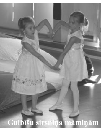
Gulbīšu sirsniņa māmiņām

Katram no mums ir divi sargeņģeli – viens, kuru mēs ne redzam, ne dzirdam, ne arī varam sataustīt, bet tomēr jūtam blakus, otrs – kuru mēs varam sajust ar visām savām maņām - tā ir māmiņa. Māmiņa - Cilvēks zemes virsū, kam nav nekā dārgāka par Sev dāvāto bērnu. Cilvēks, kas pašai aizliedzīgi ņems visu Tavu dzīves smagumu sev uz krūtīm, un ne mirkli neizrādīs, ka ir smagi. Tāpēc Stārķīšu grupas bērni šajos vismīļākajos svētkos savām māmiņām sarūpēja neaizmirstamu koncertu.