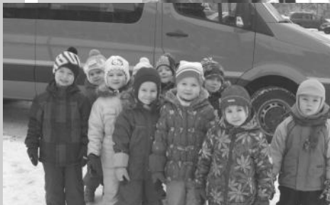
Paldies Mārupes novada Domei par iespēju izmantot skolēnu autobusu ekskursijām

PII “Zeltrīti” izdevums Sastādīja Zanda Melkina Izmantoti fragmenti no PII “Zeltrīti” publikācijām “Mārupes Vēstis”.