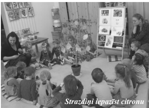
Strazdiņi iepazīst citronu

dalījās domās, kas ir tas svarīgākais, lai izaugtu veseli un lieli;